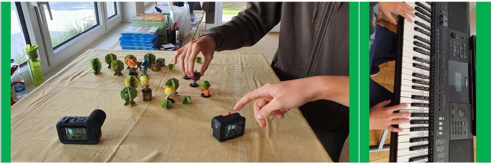
Video, Musik, Kochen – für jede*n ist etwas dabei bei „Pimp Your Mind“

Die „Pimp Your Mind“ - Mittagsbänder der ZooKultur können endlich in der neuen Oberschule stattfinden. Im ersten „Fix Food“ - Kurs haben die Schüler*innen zusammen mit Museumspädagoge Zdeněk Dytrt leckere Kartoffelpuffer gebraten. Sie haben Kartoffeln geschnitten, geraspelt und anschließend selbst angebraten. Auch das Apfelmus wurde selbst gemacht. Dazu haben die Schüler*innen unter Anleitung die Äpfel selbst geschält, zerkleinert und anschließend aufgekocht. Für einige von ihnen war es das erste Mal und eine interessante neue Erfahrung.